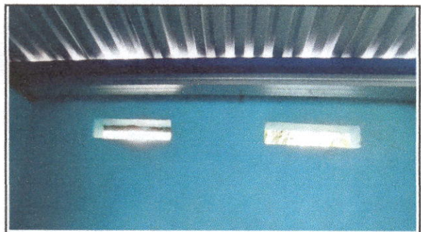
FOTO 4: Sustitución de canal de metal (incluye mano de obra) EN COCINA