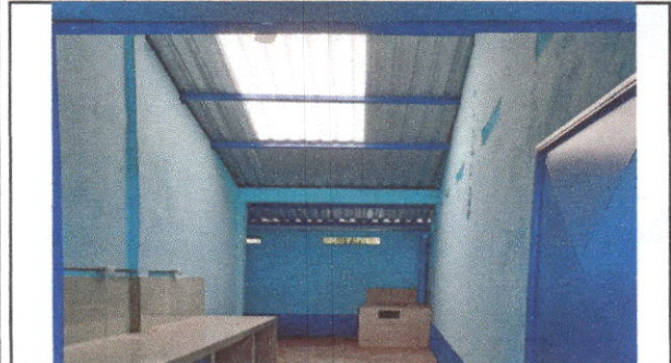
FOTO 1: Sustitución de lámina, por lámina troquelada aluzinc calibre 26 Y Sustitución de estructura de soporte de madera, por metal EN COCINA