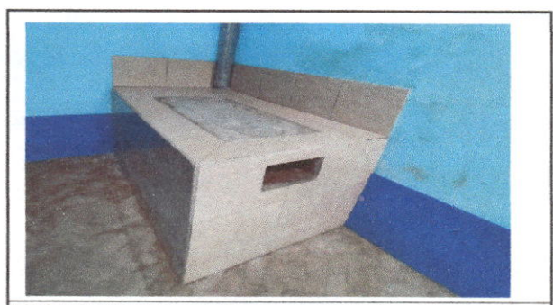
FOTO 6: Sustitución de estufa rural (completa) incluye chimenea y plancha de metal

Observación: Si es necesario se pueden agregar hojas adicionales y actualizar el número de hojas.