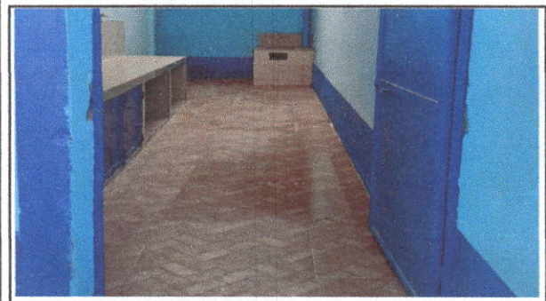
FOTO 3: Sustitución de piso de cemento líquido por piso cerámico(incluye mano de obra) EN COCINA